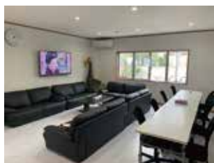
リラックスルーム